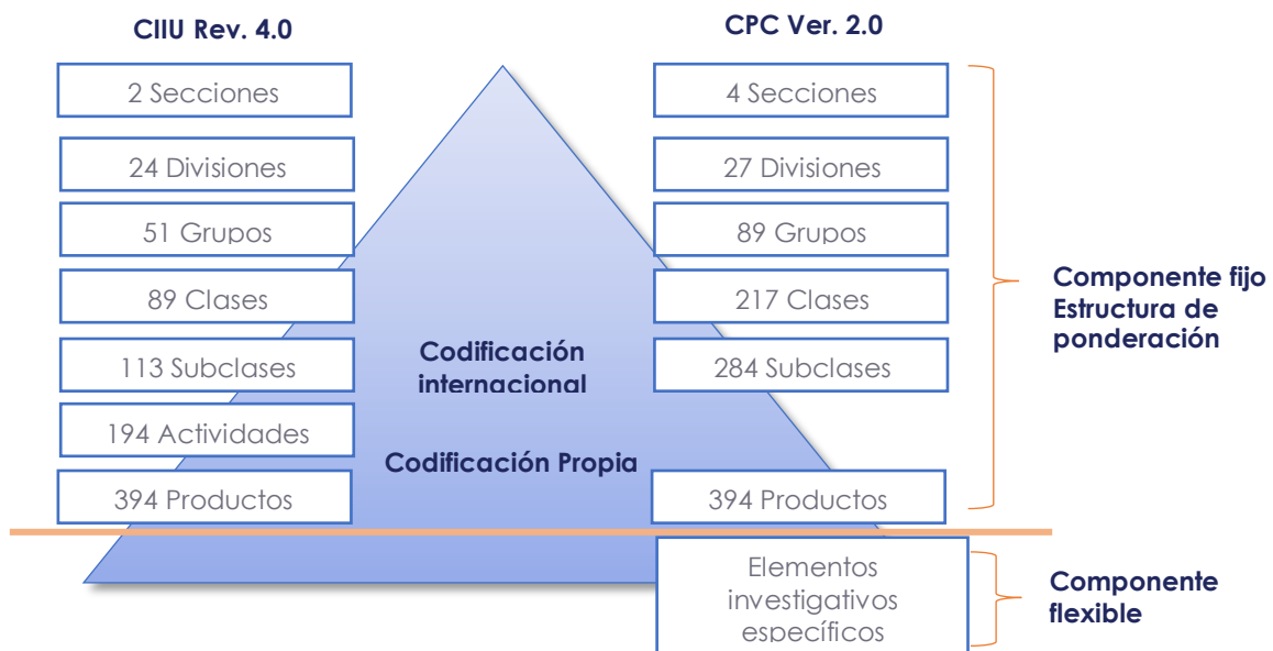
Ilustración 1. Estructura de la canasta del IPP-DN