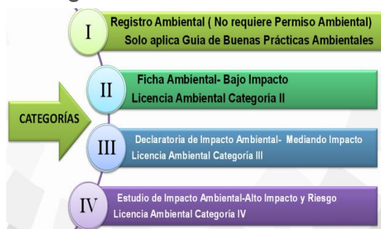
Figura 1. Permisos Ambientales

Según el Artículo 14 del Registro Oficial de mayo 2015, se considera desde esta fecha en adelante únicamente tres categorías 1 de permisos ambientales: