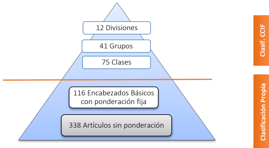
Figura 2: Estructura de las Canasta IPCEG