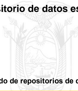
Cuadro No. 14