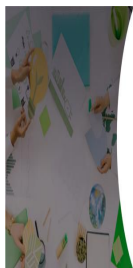
Tabla 4: Gastos corrientes y gasto corriente medio por empresa en bienes y servicios