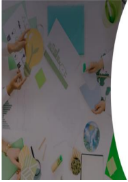
Tabla 15: Empresas que captaron agua de fuentes naturales que tienen autorización de Senagua, por tipo de actividad