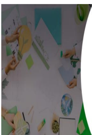
Tabla 13: Agua de red pública, cantidad, valor pagado, consumo medio, valor pagado medio por empresa y tarifa media, por tipo de actividad económica