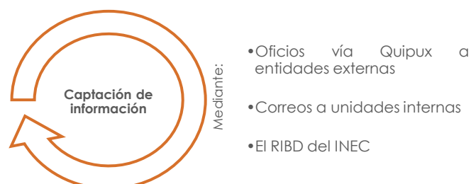
Gráfica n°1. Captación de la información

Dentro de este proceso se delimitan los métodos o los instrumentos de captación de la información para la construcción de las Cuentas Satélite de Educación.