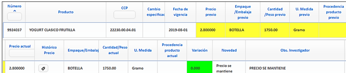
Ilustración 1 Validación IPP-DN, precio se mantiene de un mes a otro