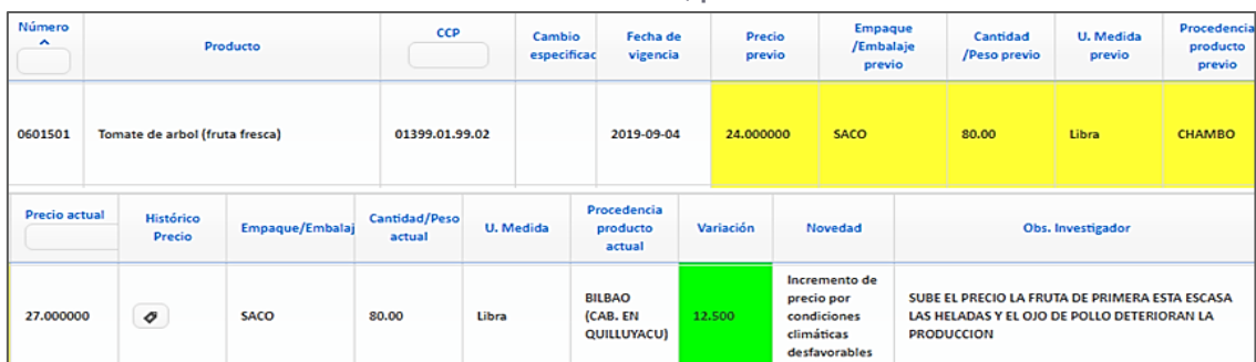
Ilustración 2 Validación IPP-DN, precio varía de un mes a otro