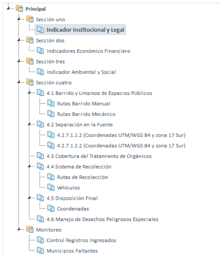
Ilustración 3. Estructura visual, Formulario GRS 2023