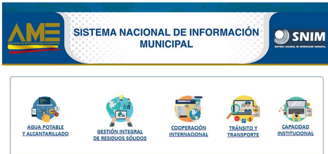
Ilustración 1. Aplicativo SNIM