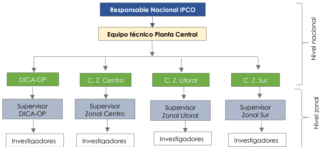
Ilustración 1 Estructura funcional y organizacional del IPCO

Elaboración: Equipo de Estadísticas Económicas